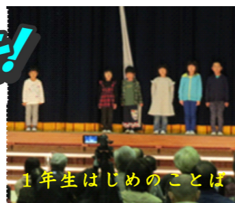
1年生はじめのことば

10月20日(土)学習発表会が開催されました。今年度の学習発表会のスローガンは、「役になりきり力を合わせて感動を」でした。子どもたちの発表は、みなさんに感動を与えたでしょうか。