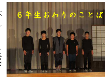
6年生おわりのことば

5名という少ない6年生でしたが、一人一人の存在感を感じ、確実に卒業への道を歩んでいることにうれしさを覚えました。